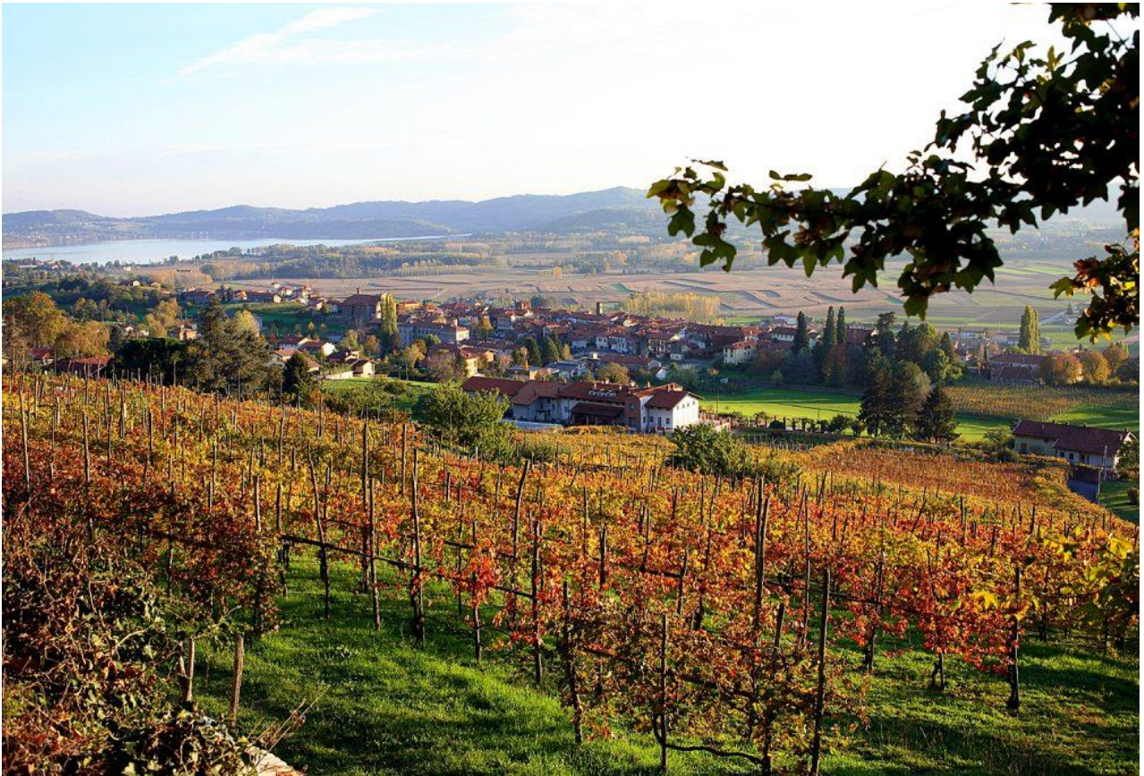
Vigneti di Erbaluce con vista sul lago di Viverone

Proseguiamo per chiudere l'anello attraverso un boschetto, vigneti, frutteti e caratteristici Ciabot, sempre con vista sul Lago di Viverone e sulle colline circostanti.